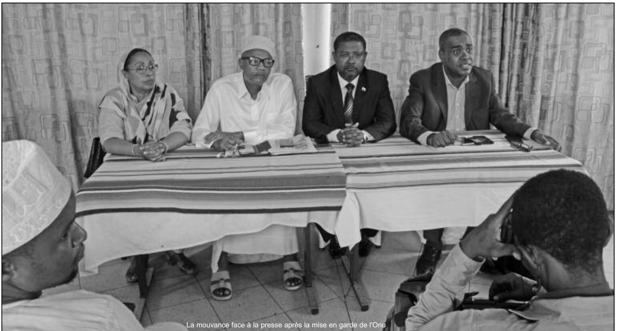
La mouvance face à la presse après la mise en garde de l'Onu