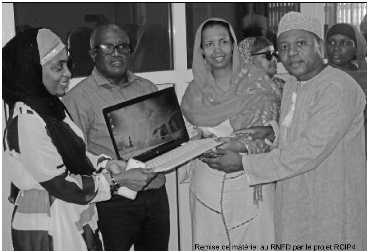
Remise de matériel au RNFD par le projet RCIP4

Ce lot de matériels est composé de 10 ordinateurs portables et ses accessoires, dont 10 disques durs